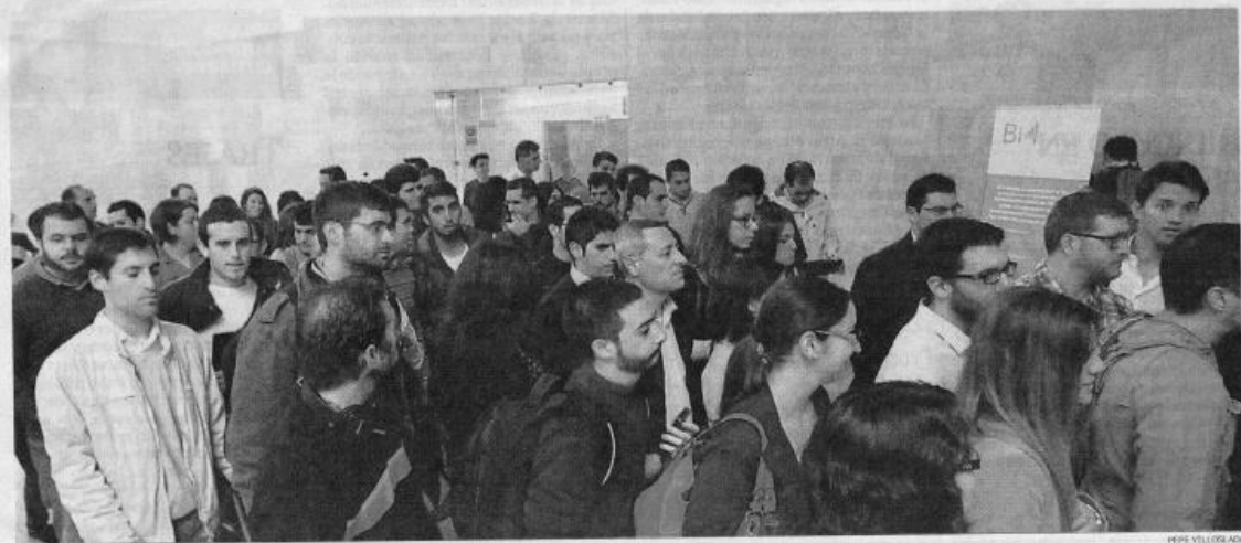
A la jornada de contratación de onGranada Tech City acudieron más de 200 jóvenes para un centenar de puestos de trabajo.

INNOVACIÓN | NUEVO NICHOS DE EMPLEO EN LA PROVINCIA