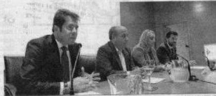
Las instituciones participan en el proyecto de futuro de la provincia.

● El Ayuntamiento no quiere que las empresas aleguen falta de espacio para instalarse en la ciudad ● El proyecto Tech City ofertó ayer 103 puestos de trabajo indefinidos