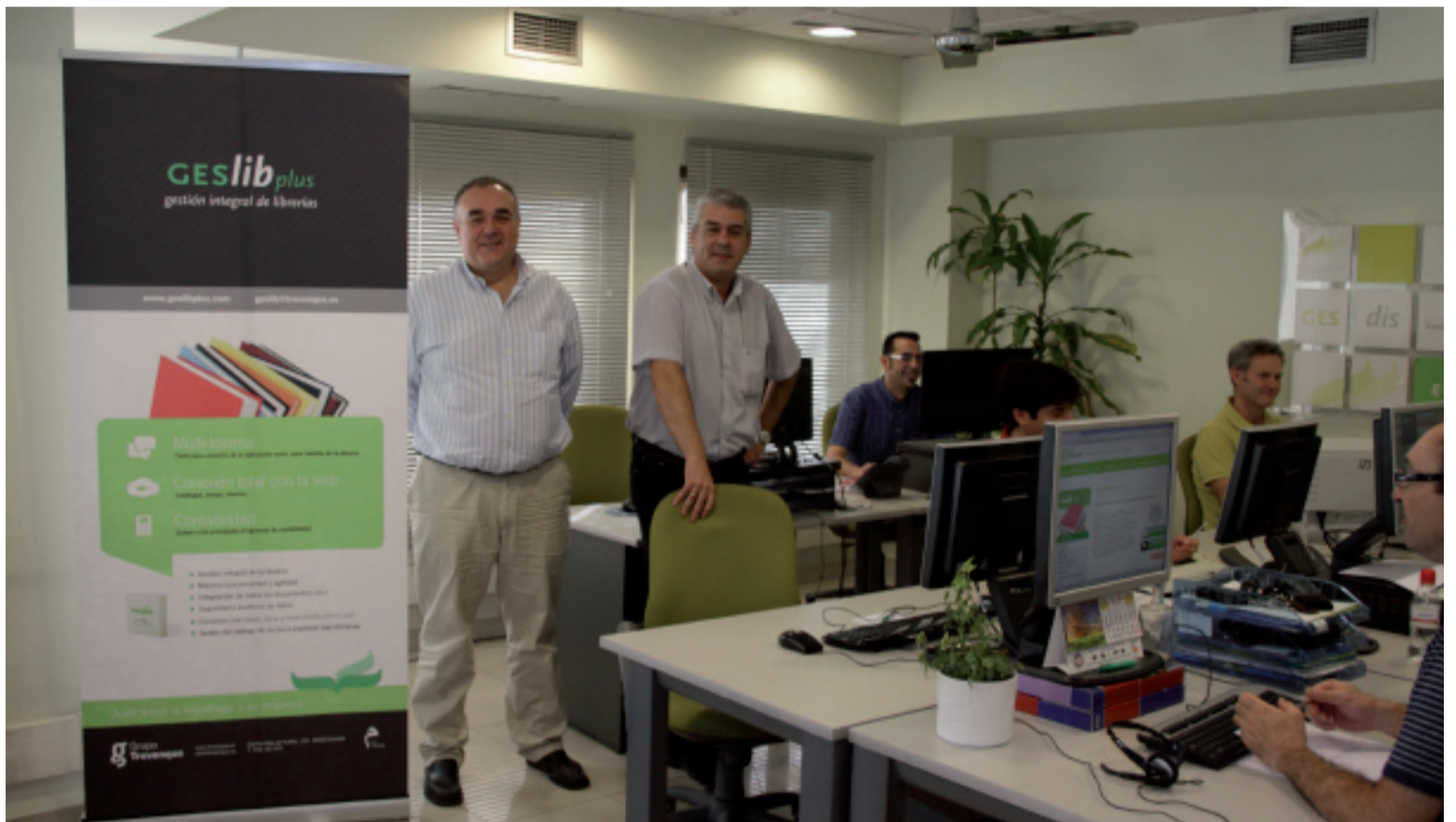
El equipo de desarrollo y soporte de Geslib Plus, el software utilizado por más de 550 librerías en España y en Latino América.

A nivel local, Grupo Trevenque es proveedor tecnológico de soluciones globales para empresas. Se trata de un servicio de outsourcing o externalización, desde el punto de vista de aquellas empresas que carecen de departamento informático. “Gestionamos todas las necesidades informáticas de nuestros clientes, desde la instalación de un ordenador nuevo y de una red, la gestión de la seguridad de la infor-